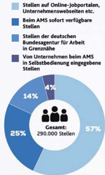
WIE VIELE JOBS ES INSGESAMT GIBT